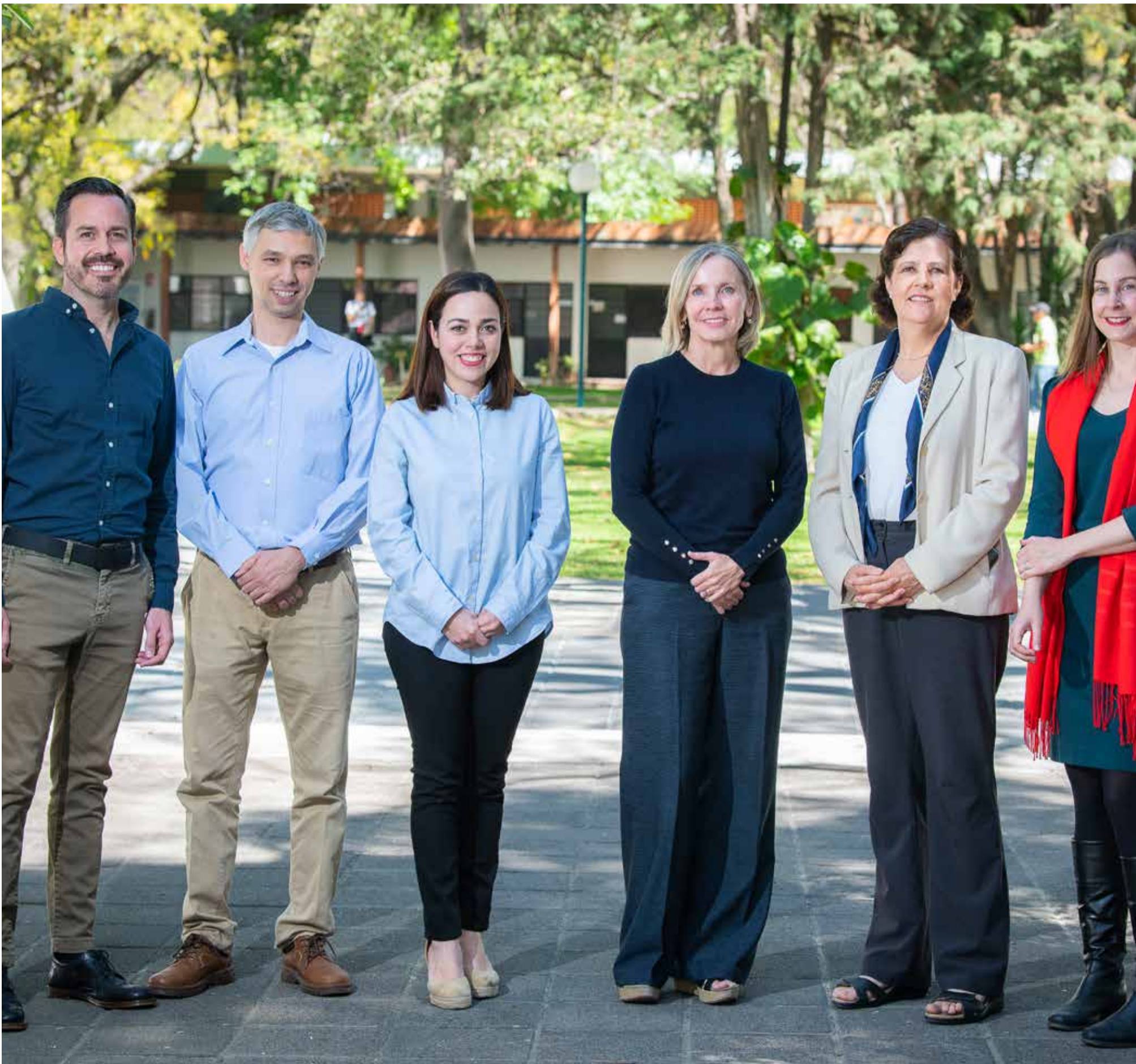
Integrantes de la Oficina de Internacionalización impulsarán la movilidad académica de estudiantes y profesorado.