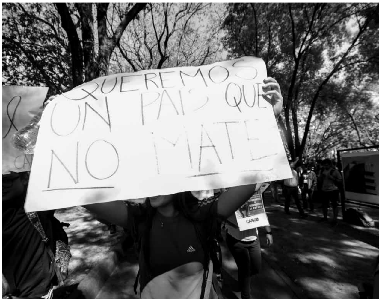
Existen diferentes barreras que obstaculizan el acceso a la justicia de las personas. La pobreza, violencia, discriminación, desigualdad social son algunas de ellas.

La Clínica Jurídica Ignacio Ellacuría, SJ, tiene el firme compromiso de seguir trabajando en favor de los más desfavorecidos donde se coloque en el centro la dignidad humana de la persona y el eje transversal sean los derechos humanos, la cultura de paz y la perspectiva de género.