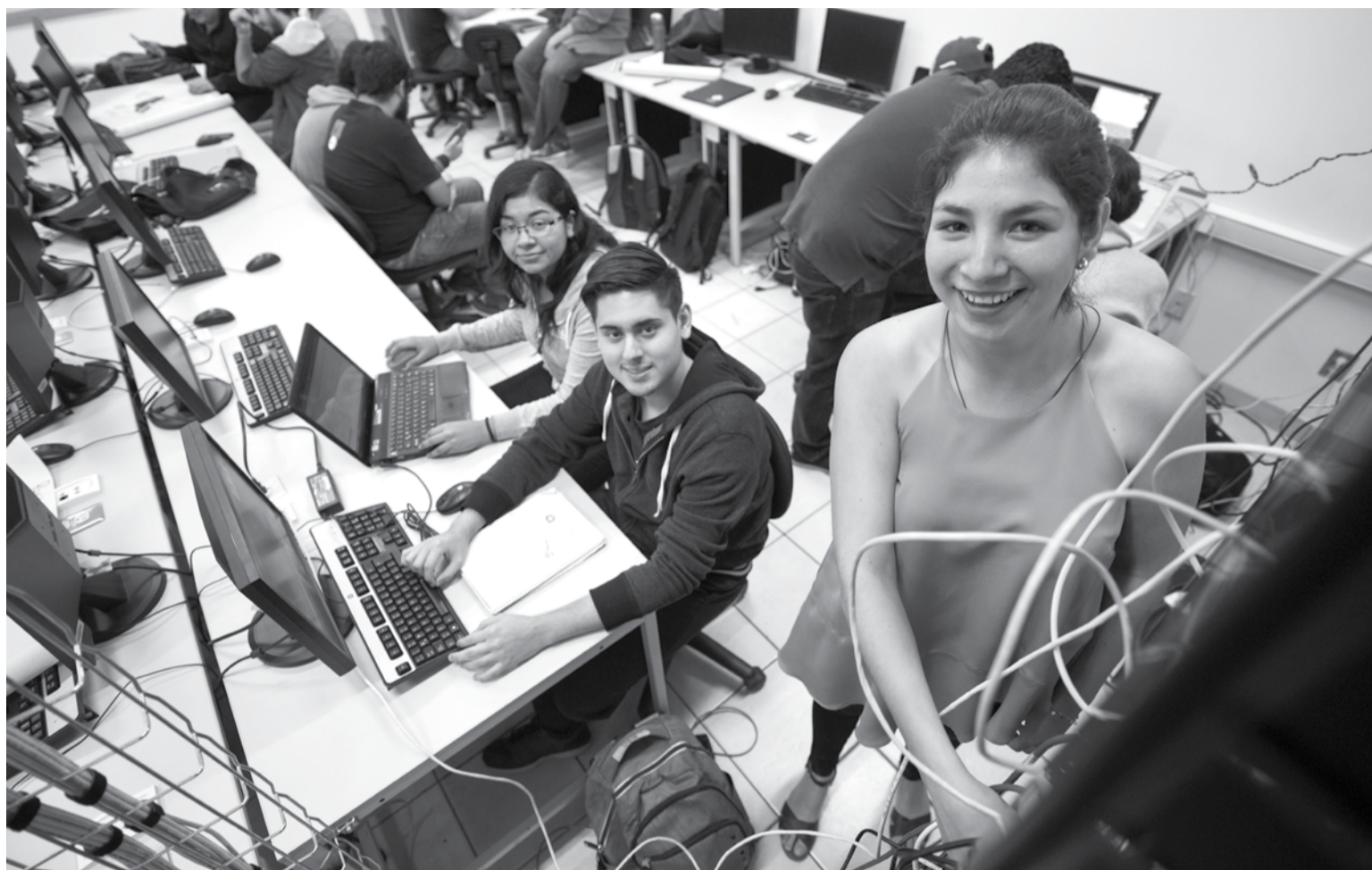
Todas y todos estamos invitados a crear. Prepara ya tu invento.